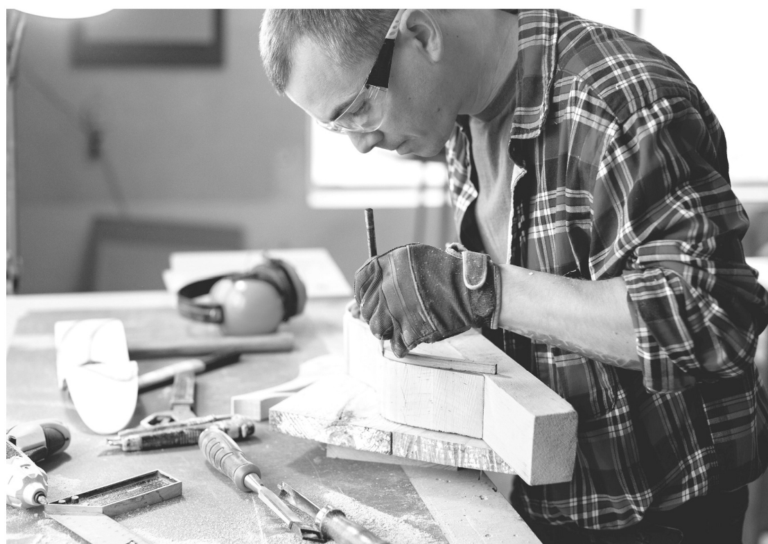
Деньги, полученные по соцконтракту на своё дело, можно потратить на приобретение оборудования, инструментов, оргтехники, расходных материалов, на аренду помещения...

По направлению «поиск работы» гражданину необходимо зарегистрироваться в Центре занятости населения и получить статус безработного или ищущего работу. При заключении соцконтракта ему выплатят 15 324 рубля в первый месяц поиска работы, и при трудоустройстве это пособие будут платить ещё три месяца. Также можно рассчитывать на единовременную выплату на курс обучения в